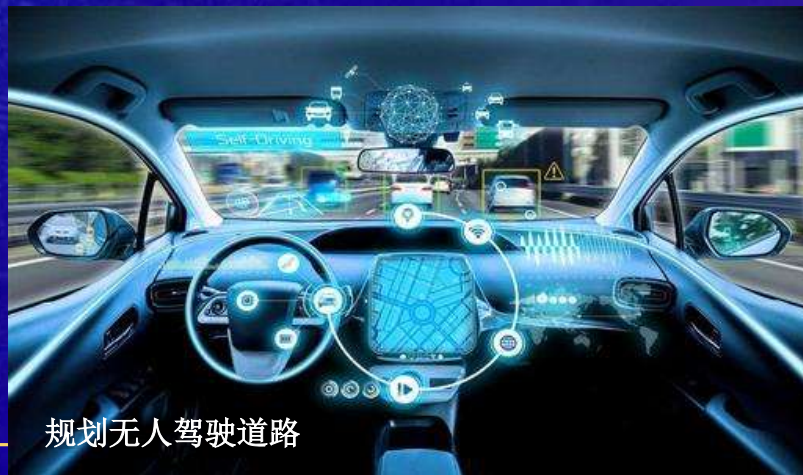
规划无人驾驶道路

金盏国际合作服务区将打造全球领先的科技基础环境。在基础网络方面，实现光纤网络普及和5G全域连续覆盖，全面满足4K/8K、VR/AR等业务应用需求。在通用能力设施方面，园区内提前布局物联网、车联网，推动智能感知设施、车路协同设施等成网部署，建设全域覆盖的智能感知网络，全面构建数字孪生城市底座；试点离岸数据中心接入配套，为外国使馆、国际组织、跨国公司开展跨境业务提供有力支撑。