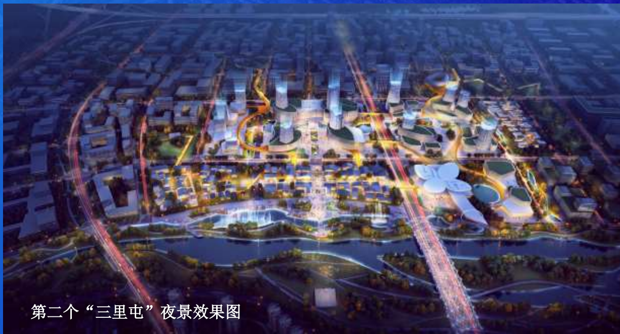
第二个“三里屯”夜景效果图

布局国际文化艺术中心、街区式滨水商业区、中国时尚展示区、主题休闲娱乐区、城市航站楼、轨道时尚商街六大主题功能区域。