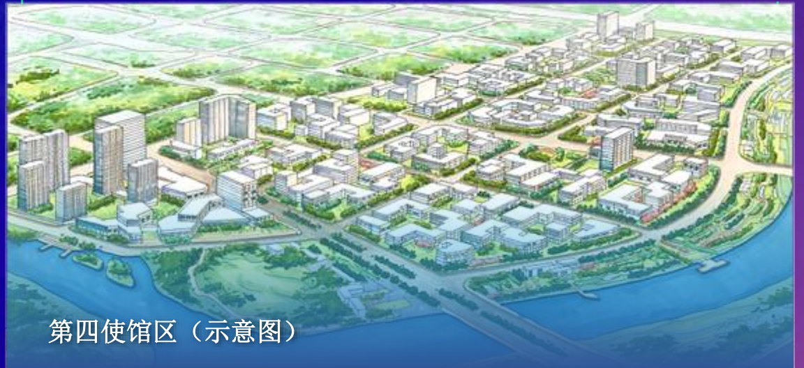
第四使馆区（示意图）

第四使馆区规划方案着重体现“保障安全，布局合理，功能完善，资源集约，人文、地域、自然有机交融”的理念，建设内容主要包括外交馆舍、各类配套设施（包括外交办公大楼、外交公寓、国际学校、市政配套设施等）及武警营房等安全设施，规划总建筑面积约 82.6 万平方米，在确保满足外交馆舍建设需求的基础上，实现较为优越的环境条件，致力于将第四使馆区打造成符合北京城市战略定位、体现城市发展水平，体现中国大国形象与担当，适应大国外交发展需要，保障和促进我国外交事业发展的新使馆区。