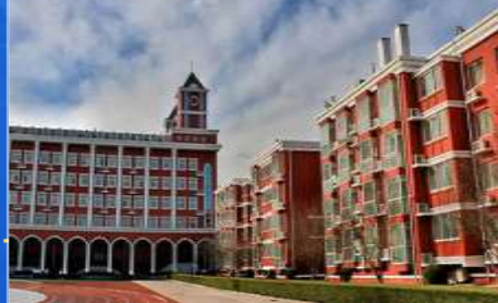
北京爱迪国际学校